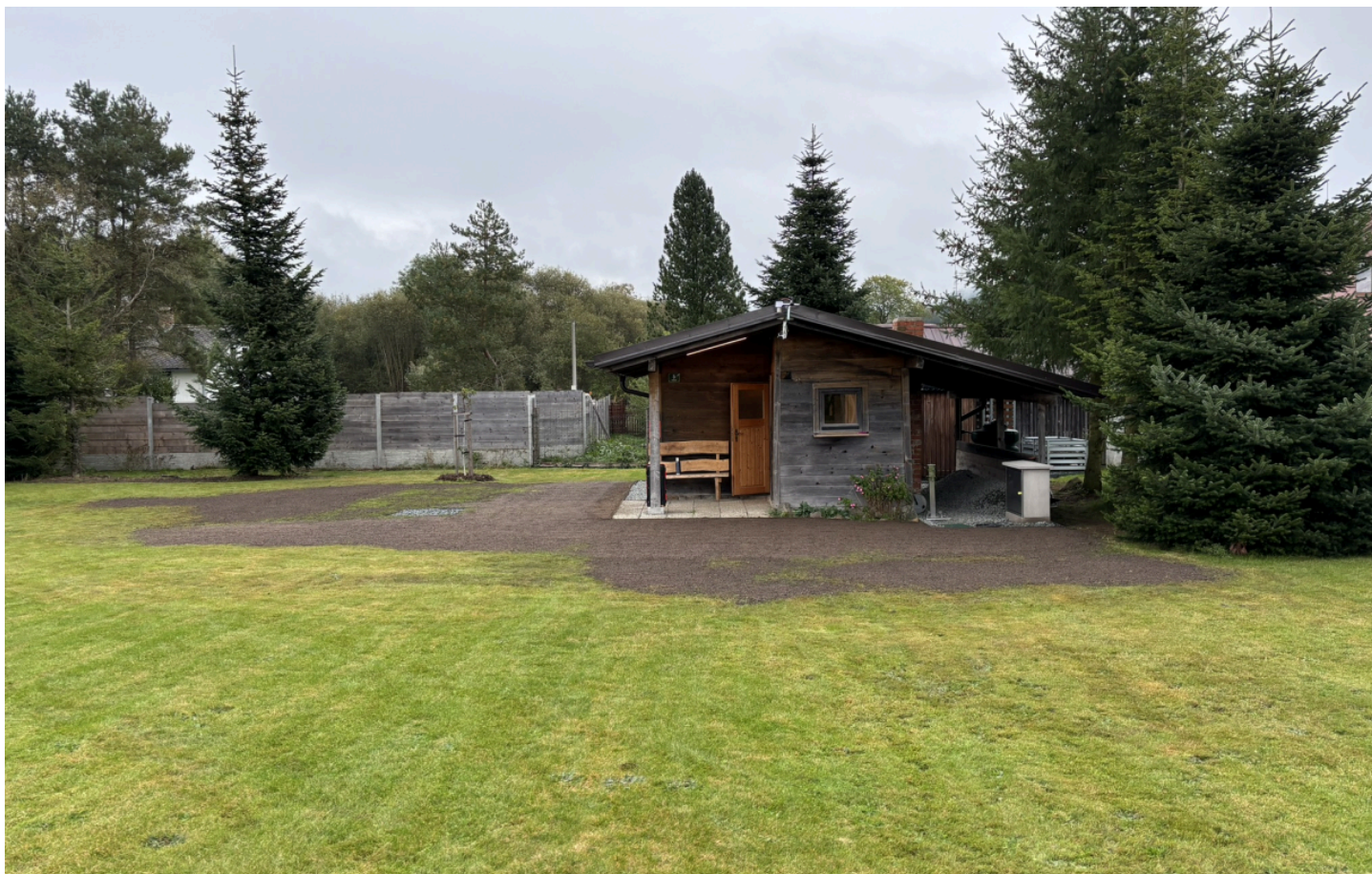
Obrázek č. 1: úpravy terénu v bezprostředním okolí zahradní chatky

V prvním říjnovém týdnu roku 2024 jsme na pozemku provedli některé zahradní úpravy. Zejména jsme srovnali a znovu oseli trávník v bezprostřední blízkosti zahradní chatky. Zahradní chatka zůstala přístupná, ale je třeba chodit po vytyčených trasách tak, aby ošetřené plochy zůstaly neporušené.