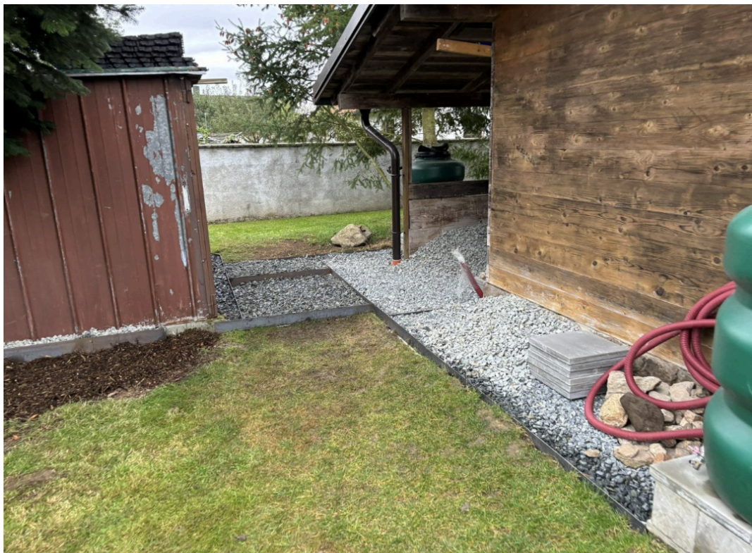
Obrázek č. 4: terénní schod vzadu za chatou

Dovoluji si také upozornit na terénní schod mezi dvěma povrchy vzadu za chatou. Vzhledem k počasí jsme nezvládli zatravněnou plochu doplnit substrátem - musíme s tím počkat až na jaro.