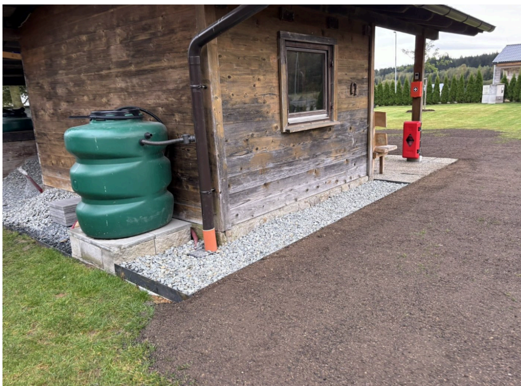
Obrázek číslo 3: zobrazení okapového chodníku se štěrčkem využitelného k přístupu do zahradní chatky

Níže je vidět okapový chodník se štěrčkem, který je využitelný pro bezproblémový přístup do chatky: